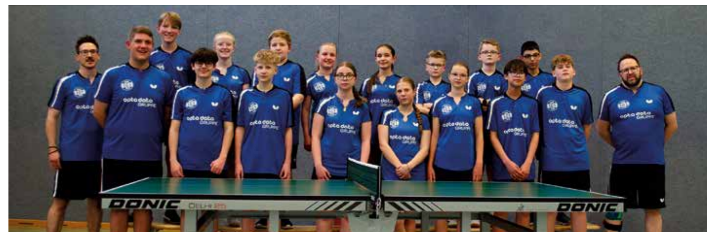
Nachwuchsarbeit mit Herz und Erfolg