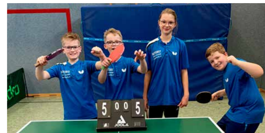
Unsere Jüngsten spielten ihre erste Saison.

Mit großem Trainingsfleiß wollen wir nun den Grundstein für kommende Erfolge legen. Mit engagierten Trainerinnen und Trainern, motivierten Spielerinnen und Spielern schauen wir positiv auf die kommende Saison.