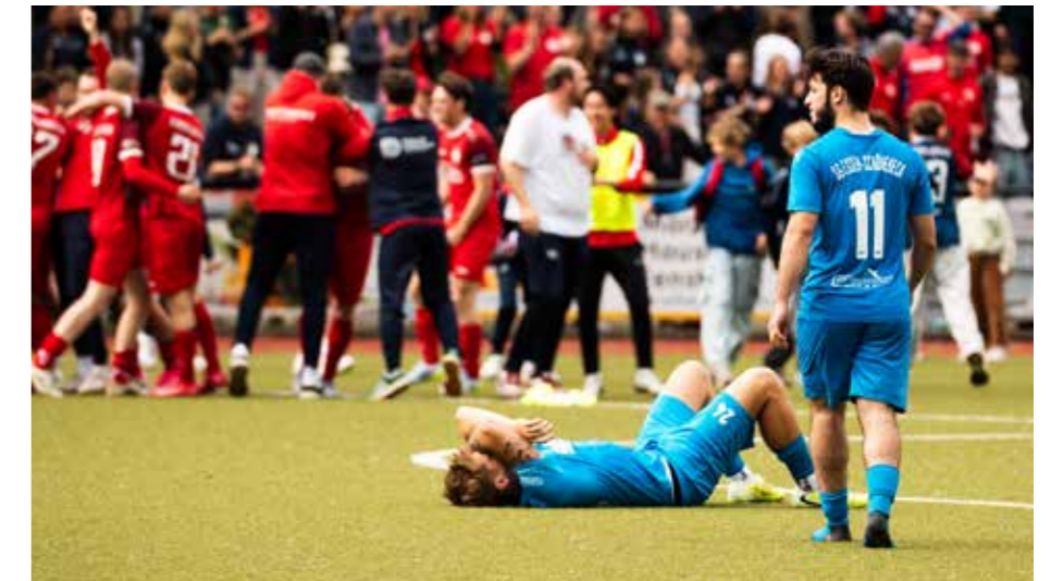
Abstieg: Nach drei Jahren Landesliga geht es in der nächsten Spielzeit für die 1. Herren in der Bezirksliga weiter.

Neben den Frauen der SGS, deren Abstieg in die Zweite Bundesliga seit Mitte Mai feststeht, muss auch die Erste der Herren in der kommenden Spielzeit eine Liga tiefer antreten. Die Mannschaft konnte einen zwischenzeitlichen 11-Punkte-Vorsprung nicht ins Ziel bringen und verlor beim „Endspielgegner“ SC Werden-Heidhausen am letzten Spieltag durch ein Tor in der 89. Minute 1:2 im Löwental und rutschte damit auf den Abstiegsplatz. Nach 3 Jahren in der Landesliga geht es ab August dann in der Bezirksliga weiter.