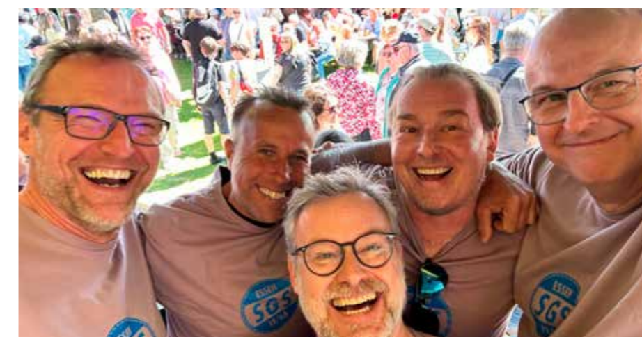
Ob auf dem Platz oder auf dem Maifest und Handwerkermarkt: Die Ü32 kämpfte immer bis zum „Abpfiff“.