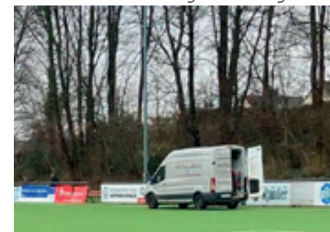
Immer wieder kam Metallbau Bas aus Mettmann, um – neben dem laufenden eigenen Betrieb – die Banden an der Ardelhütte sukzessive auf den sichersten Stand zu bringen.