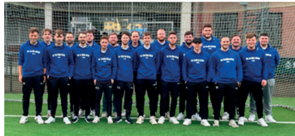
Die Jungs aus unserer Vierten mit den neuen Oberteilen ...

Frohnhauser Str. 448 | 45144 Essen | 0201/876990