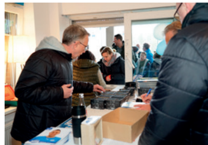
Lange Schlangen bildeten sich an der Kasse. Alle wollten Album und Sticker-tütchen kaufen.