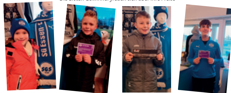
Die Ersten Gewinner freuen sich über ihre Preise