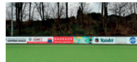
Alle Banden sind im besten und sichersten Zustand.

Damit dürfte die SGS einer der ersten Vereine im Kreis sein, die diese Vorgabe umgesetzt haben. Fussball an der Ardelhütte soll auch weiterhin gesichert Spaß machen!