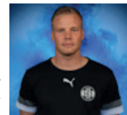
Bei Hatchi steht noch eine Entscheidung aus.