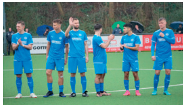
Ein Bild mit Symbolcharakter? Die Mienen der Spieler reichen von „klappt schon“ bis „skeptisch“.

Diese Situation bei den Gästen wird die Rehmannelf aber nicht dazu verleiten, Hö-Ni. auf die leichte Schulter zu nehmen wie unser Coach im Vorgespräch verrät: